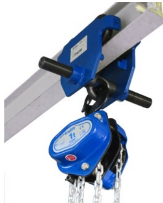
Rollkatze Corso GCP mit Flaschenzug Tralift

Informieren Sie sich über unseren Prüf- und Reparaturdienst!