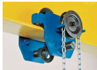
Haspelkatze Corso GCG