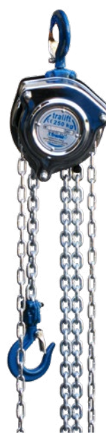
250 kg Tragfähigkeit