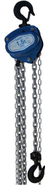
1.500 kg Tragfähigkeit

Hebezeuge unterliegen den Unfallverhütungs-Vorschriften DGUV Vorschrift 54 und müssen daher durch einen Sachkundigen mindestens einmal jährlich überprüft werden.